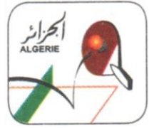
TABLEAU DE 16