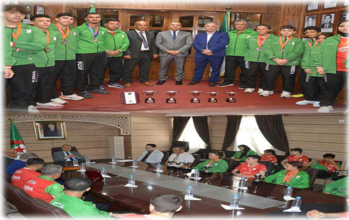
استقبال معالي وزير الرياضة السيد وليد صادي بعد النتائج التاريخية خلال البطولة الأفريقية لشباب 2025

وبهذه المناسبة، تتقدم الهيئة المشرفة بخالص عبارات الشكر والتقدير إلى الوزارة الوصية على دعمها المتواصل وحرصها الدائم على توفير كل الإمكانيات اللازمة، كما تتّمّن الجهود المبذولة من طرف الأطقم الفنية والإدارية، التي ساهمت باحترافية عالية في تحقيق الأهداف المرجوة وكذلك كل النوادي والرابطات المعنية