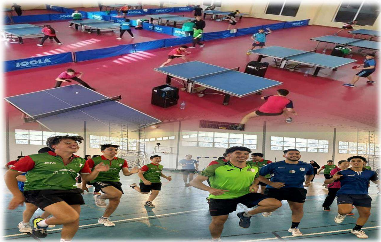
التحضيرات في قاعة الاتحادية بالمركز الوطني لنخبة الوطنية بفوكة.